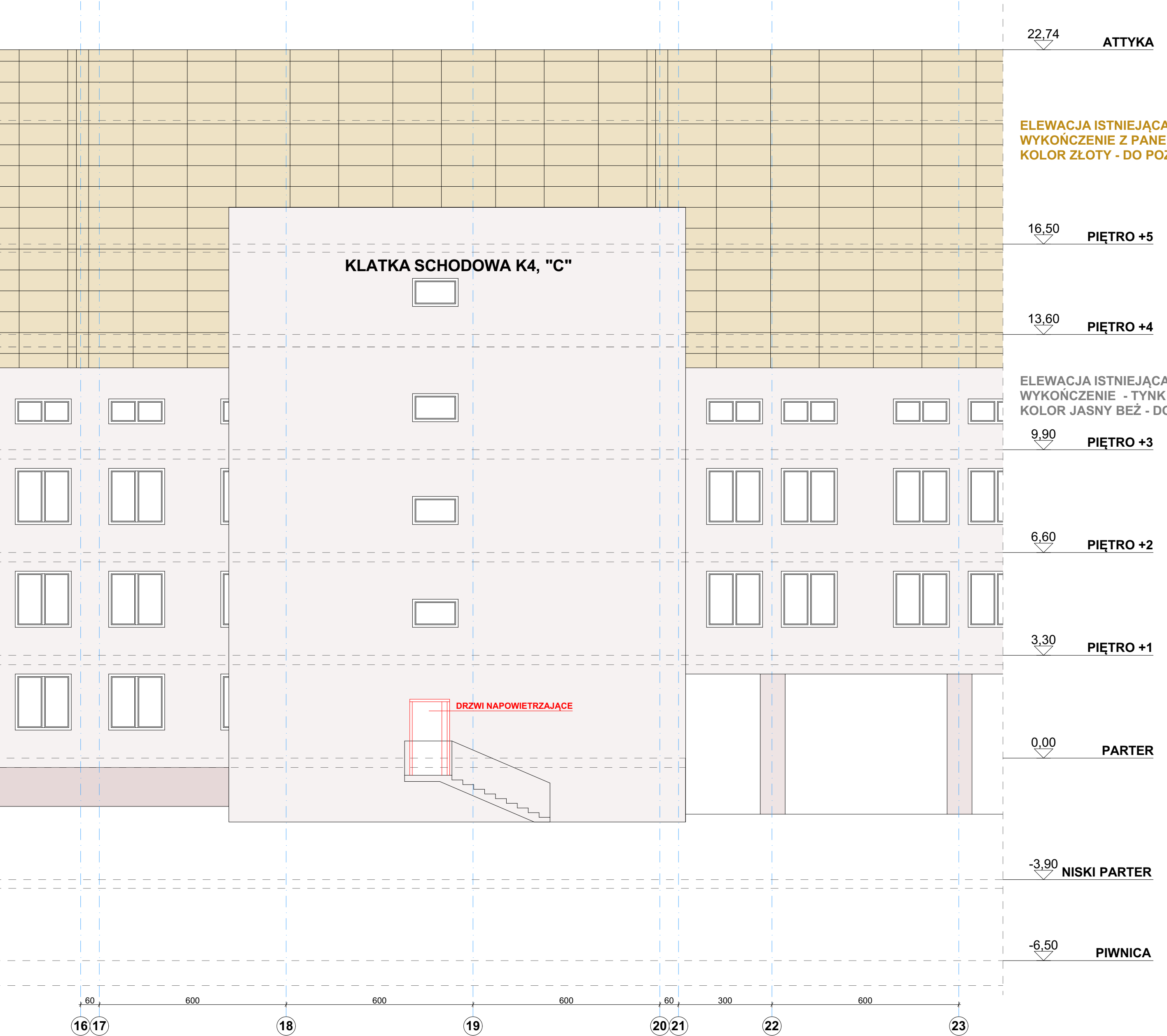
ELEWACJA PÓŁNOCNA - KŁATKA SCHODOWA K4